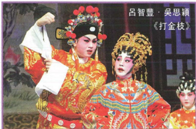
呂智豐·吳思穎 《打金枝》